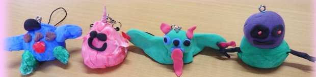
絵本“おばけのコンサート”のおばけくも